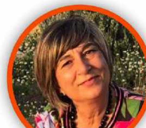
GIOVANNA MARIA BURRELLI SCUOLA PRIMARIA