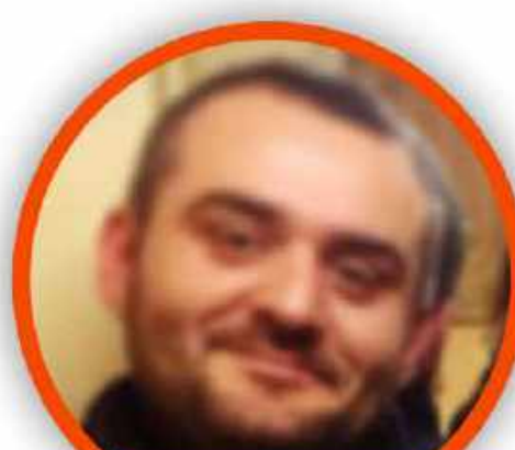
ROBERTO ZOLLO SCUOLA PRIMARIA